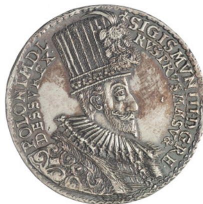
2. Medalier nieokreślony, awers medalu z wizerunkiem Zygmunta III w wysokim kapeluszu, Polska, 1588, Zamek Królewski w Warszawie – Muzeum, nr inw. ZKW.N.10006. / Unknown medallist, obverse of the medal with the portrait of Sigismund III in a high hat, Poland, 1588, the Royal Castle in Warsaw – Museum, inv. no. ZKW.N.10006.

W kancelarii Mołdawii znana była oczywiście koncepcja obywatelstwa szlacheckiego wykluczającego poddaństwo osobiste. Skoro Mohyła, od 1593 r. polski indygena, podpisywał listy formułą „wierny poddany i życzliwy sługa”, należy przypuszczać, że akceptował ideę poddaństwa z całą odpowiedzialnością (słowo „sługa” należy rozumieć jako osobę chcącą świadczyć usługi 30 ). Po bitwie pod Suczawą (1595) pragnął wysłać królowi na sejm chorągiew zdobytą wówczas przez Mołdawian 31 , aby podkreślić własne zasługi. Po otrzymaniu listu z rozkazem królewskim wspominał następnie ten fakt w dwóch kolejnych pismach do Zygmunta III 32 . Warto również zwrócić uwagę na to, że postulował się mitem dobrego władcy. „Mówił, że jest pewien łaski jego króla mci, iż go obciążyć nie będzie nad tym co można” – napisał po rozmowie z nim w 1600 r.