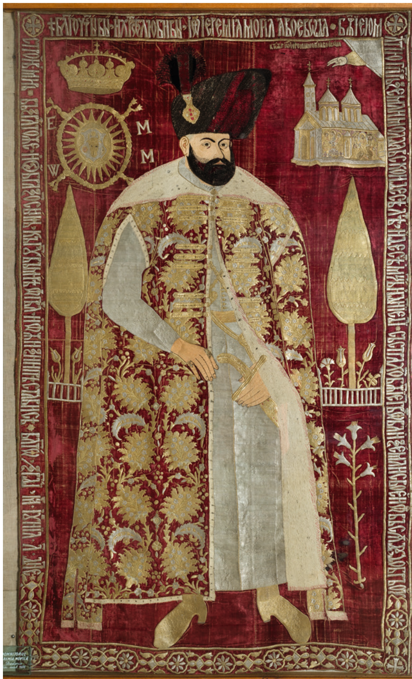
1. Warsztat moldawski, Zaslona grobowa z portretem Jeremiego Mohyły , haft srebrną i złotą nicią, jedwabiem i perłami na podłożu z czerwonego aksamitu, kolekcja muzealna klasztoru Sucevița. / Moldavian workshop, Tomb cover with the Portrait of Jeremiah Movila , silver and gold thread embroidery with silk and pearls on the red velvet, museum collection of Sucevița Monastery.