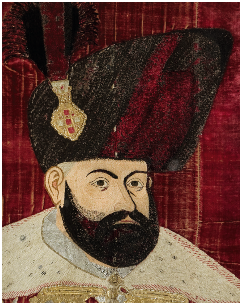
4. Fragment il. 1. Detail of illustration 1.

Odpowiedź powinna być znuansowana. Jeśli w pierwszej części panowania Jeremiego Mohyły kanclerz za pośrednictwem Piotra Tylickiego lub przez osobiste interwencje w senacie sugerował królowi lub członkom senatu, jakie podejście należy zainicjować wobec Mołdawii, to w drugiej części panowania hospodara inicjatorem wydawał się już monarcha. Tę hipotezę potwierdzają dwa listy Zygmunta III skierowane do Zamoyskiego i dwa listy wysłane przez Jeremiego do króla z pytaniem, co robić. Z pism monarchy wynika, że kanclerz został o tych sprawach również poprzednio poinformowany. Jednocześnie z jednego z listów możemy wywnioskować, że król zajmował wobec Mołdawii stanowisko proponowane przez Zamoyskiego. Ilustruje to dłuższy passus dotyczący prośby hospodara o zwrot zamku Suczawy: „o Soczawę za pisaniem uprz. Waszej, że mało coś ludzi na niej było zostało i że płacy swej niemieli,